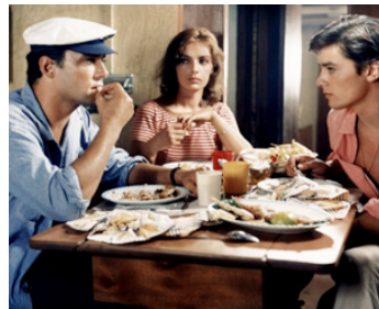
1959 PLEIN SOLEIL de René Clément avec Marie Laforêt, Alain Delon