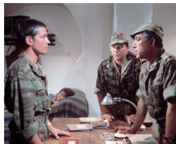
1965 LES CENTURIONS (Lost Command) de Mark Robson avec Alain Delon, Anthony Quinn