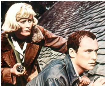
1958 AGENT SECRET SZ (Carve her name with pride) de Lewis Gilbert avec Virginia McKenna