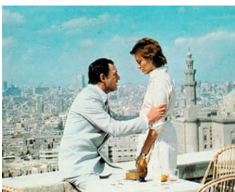
1980 SPHINX (Sphinx) de Franklin J. Schaffner avec Lesley-Ann Down