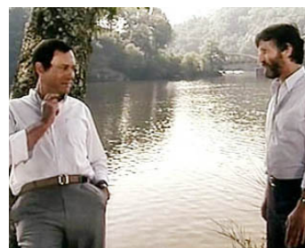
1982 UN MATIN ROUGE de Jean-Jacques Aublanc avec Claude Rich