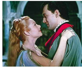
1952 LUCRÈCE BORGIA de Christian-Jaque avec Martine Carol