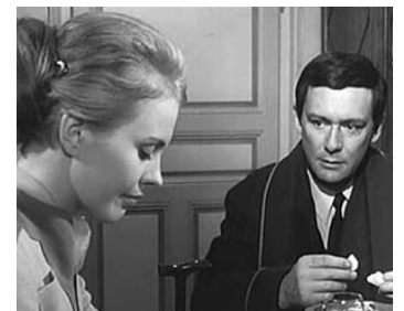
1966 LA LIGNE DE DÉMARCACTION de Claude Chabrol avec Jean Seberg