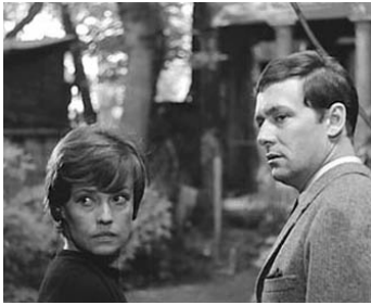
1963 LE FEU FOLLET de Louis Malle avec Jeanne Moreau