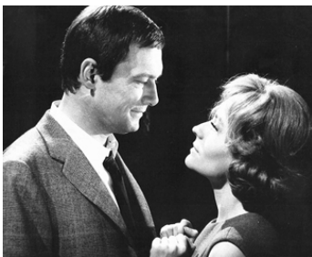
1964 TROIS CHAMBRES À MANHATTAN de Marcel Carné avec Annie Girardot