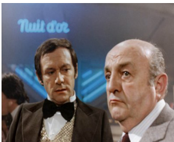
1976 NUIT D'OR de Serge Moati avec Bernard Blier