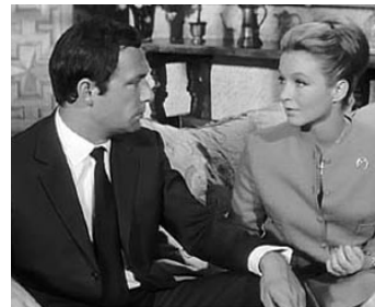
1962 LE MEURTRIER de Claude Autant-Lara avec Marina Vlady