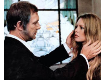
1972 DON JUAN 73 de Roger Vadim avec Brigitte Bardot