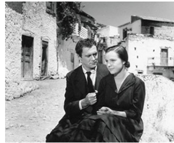
1957 CELUI QUI DOIT MOURIR de Jules Dassin avec Nicole Berger