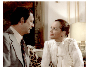
1978 LIÉS PAR LE SANG (Bloodline) de Terence Young avec Romy Schneider