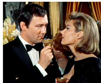
1966 LE SCANDALE de Claude Chabrol avec Suzanne Lloyd