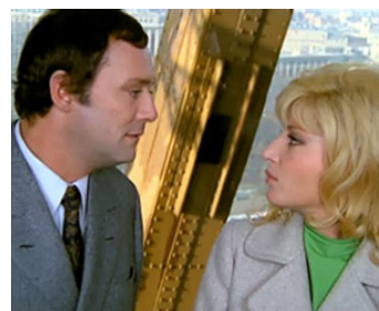
1967 LA FEMME ÉCARLATE de Jean Valère avec Monica Vitti