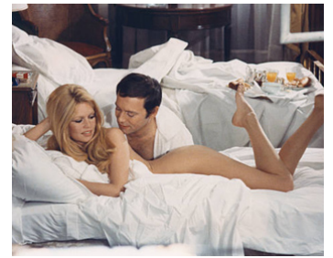
1969 LES FEMMES de Jean Aurel avec Brigitte Bardot