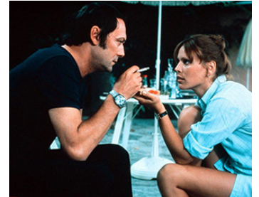
1974 SEUL LE VENT CONNAÎT LA RÉPONSE d'Alfred Vohrer avec Marthe Keller