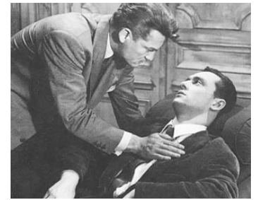
1953 LE GUÉRISSEUR d'Yves Ciampi avec Jean Marais