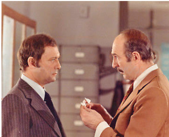
1973 L'AFFAIRE CRAZY CAPO de Patrick Jamain avec Jean-Pierre Marielle