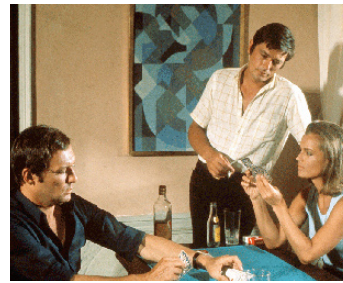
1968 LA PISCINE de Jacques Deray avec Alain Delon, Romy Schneider