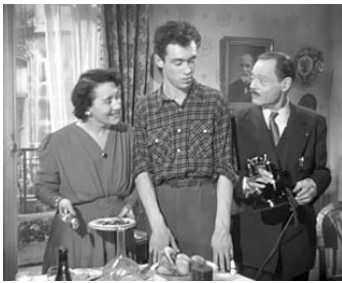
1949 RENDEZ-VOUS DE JUILLET de Jacques Becker avec Paule de Breuil, Émile Ronet