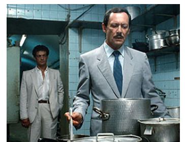
1982 LA BALANCE de Bob Swaim avec Philippe Léotard