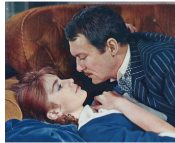
1964 LA RONDE de Roger Vadim avec Catherine Spaak