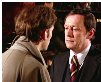
1981 BEAU-PÈRE de Bertrand Blier avec Patrick Dewaere