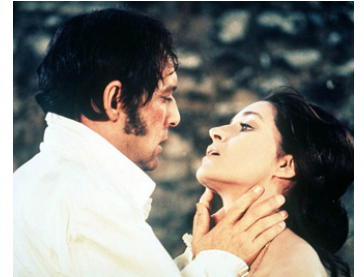
1971 RAPHAËL OU LE DÉBAUCHÉ de Michel Deville avec Françoise Fabian