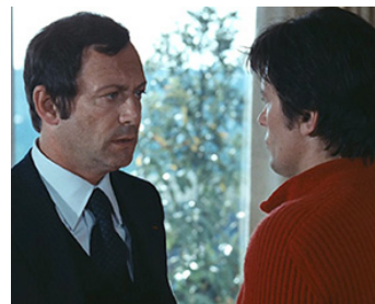
1977 MORT D'UN POURRI de Georges Lautner avec Alain Delon