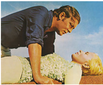
1968 LES OISEAUX VONT MOURIR AU PÉROU de Romain Gary avec Jean Seberg