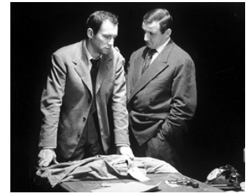
1957 ASCENSEUR POUR L'ÉCHAFAUD de Louis Malle avec Jeanne Moreau