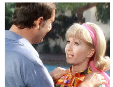
1968 ADORABLEMENT VÔTRE (How sweet it is) de Jerry Paris avec Debbie Reynolds