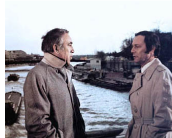
1974 MARSEILLE CONTRAT (The Marseille Contract) de Robert Parrish avec Anthony Quinn