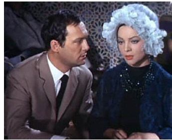
1963 CASABLANCA, NID D'ESPIONS d'Henri Decoin avec Sara Montiel