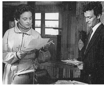
1952 HORIZONS SANS FIN de Jean Dréville avec Giselle Pascal