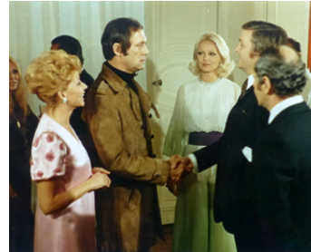
1972 LES GALETS D'ÉTRETAT de Sergio Gobbi avec Virna Lisi