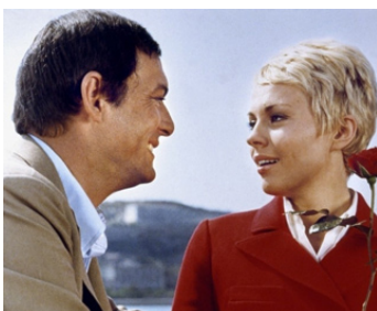
1967 LA ROUTE DE CORINTHE de Claude Chabrol avec Jean Seberg