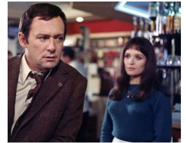
1964 LE VOLEUR DE TIBIDABO de Maurice Ronet avec Anna Karina