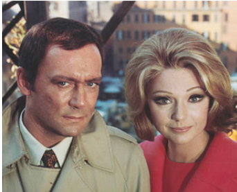
1969 LA MODIFICATION de Michel Worms avec Sylva Koscina