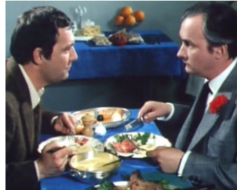
1969 LE DERNIER SAUT d'Édouard Luntz avec Michel Bouquet